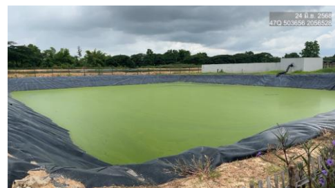
รูปที่ 2-12 บ่อพักน้ำฉุกเฉิน