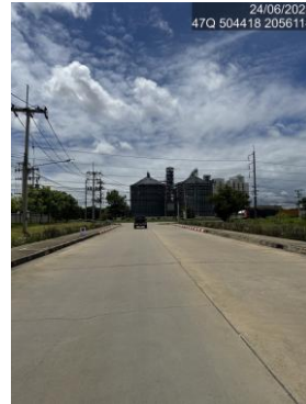
รูปที่ 2-20 ถนนบริเวณถนนหน้าโครงการ