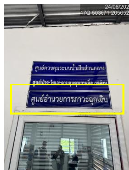
รูปที่ 2-34 ศูนย์อำนวยความสะดวก