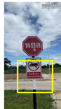
รูปที่ 2-25 การติดตั้งป้ายจราจรห้ามรถบรรทุก ใช้ทางสาธารณะที่กำหนดไว้