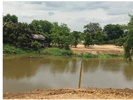
รูปที่ 2-29 การติดตั้งเสาวัดระดับในแม่น้ำกวัง