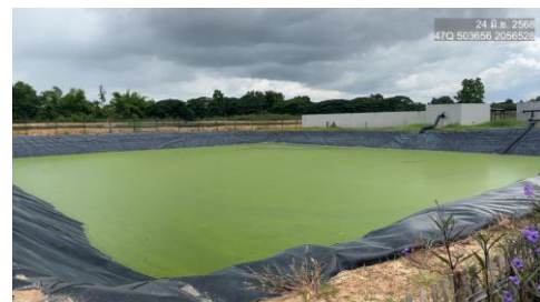
รูปที่ 2-10 บ่อเก็บน้ำเสียสำรอง