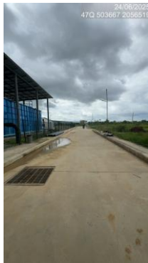
รูปที่ 2-22 ถนนภายในพื้นที่โครงการ