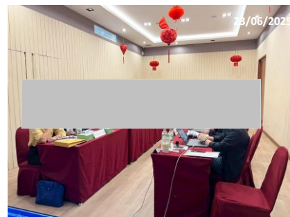
รูปที่ 2-2 การประชุมคณะกรรมการติดตามตรวจสอบผลกระทบสิ่งแวดล้อม