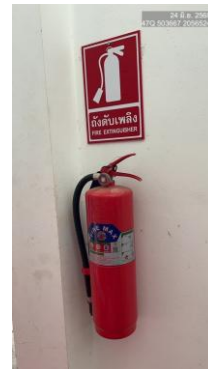
รูปที่ 2-35 อุปกรณ์ป้องกันอัคคีภัย