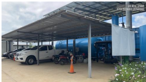
รูปที่ 2-26 พื้นที่จอดรถภายในพื้นที่โครงการ