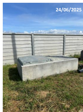
รูปที่ 2-8 ระบบระบายน้ำเสียของโรงงานอุตสาหกรรม