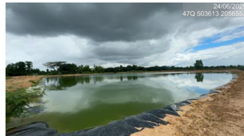
รูปที่ 2-27 บ่อหน่วงน้ำภายในพื้นที่โครงการ