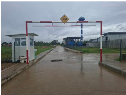
รูปที่ 2-24 การติดตั้งอุปกรณ์ควบคุมความสูง ของรถบรรทุก