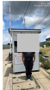
รูปที่ 2-23 เจ้าหน้าที่รักษาความปลอดภัย บริเวณพื้นที่เข้า-ออกโครงการ