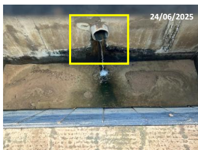
รูปที่ 2-11 การเชื่อมต่อท่อระบายน้ำเสียของโรงงานเข้ากับท่อรวบรวมน้ำเสียส่วนกลาง