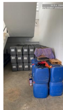
รูปที่ 2-14 การจัดเตรียมอะไหล่หรืออุปกรณ์เครื่องมือที่ใช้ในระบบบำบัดน้ำเสีย