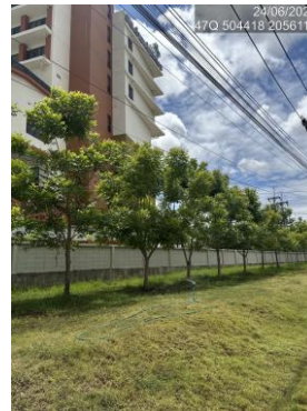
รูปที่ 2-7 การปลูกต้นไม้รอบพื้นที่โรงงานอุตสาหกรรมและพื้นที่โครงการ