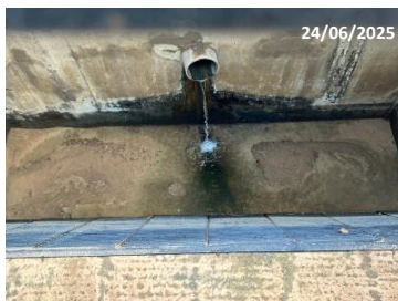
รูปที่ 2-9 บ่อตรวจคุณภาพน้ำเสีย