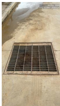
รูปที่ 2-28 ท่อระบายน้ำฝนของโครงการ