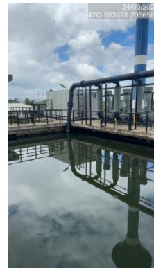
รูปที่ 2-13 ระบบรวบรวมน้ำเสียของโครงการ