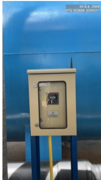
รูปที่ 2-19 ติดตั้งเครื่อง Conductivity Meter Online บริเวณระบบผลิตน้ำประปาแบบเคลื่อนย้ายได้